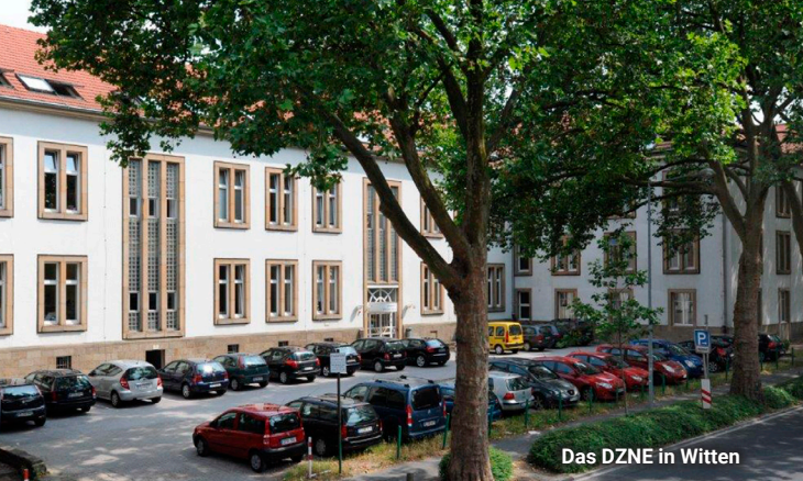
Das DZNE in Witten